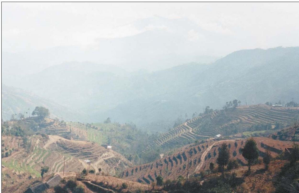
Низкие Гималаи. На вершинах гор располагаются поля-террасы.