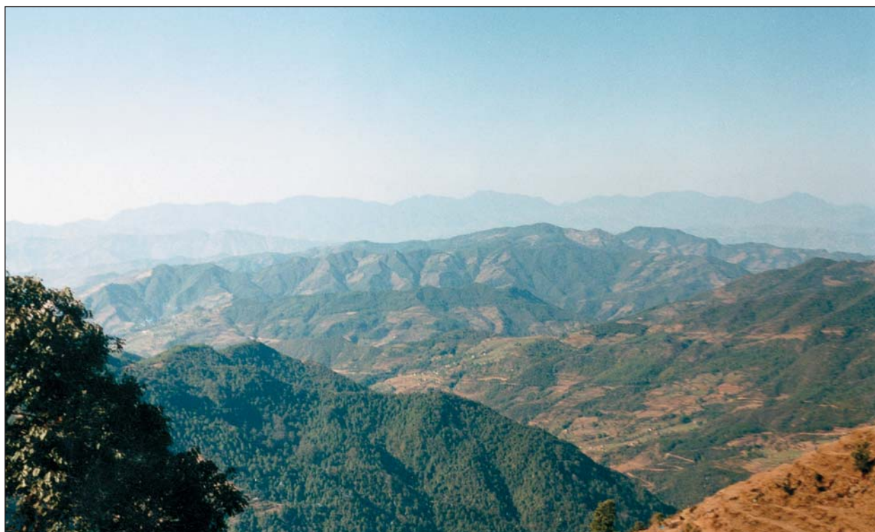
Поперечное понижение в Высоких Гималаях, разделяющее высокогорные массивы — Лантанг Гимал (слева) и Ролвалин Гимал.